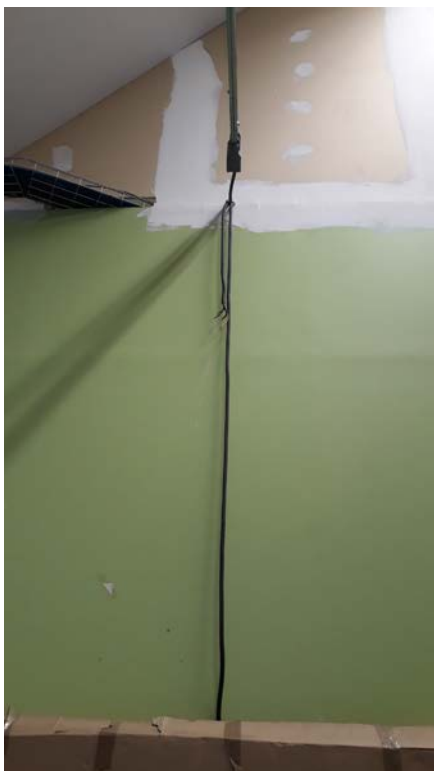
Câble électrique qui pend ?

Matériel d'entretien des espaces verts non conformes ou en mauvais état.